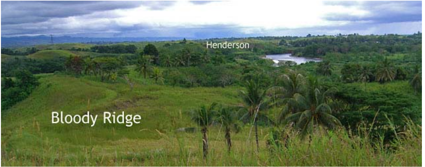
BLOODY RIDGE 1942