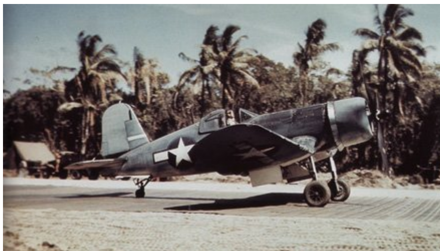
Débarquement Australien sur VELLA LAVELLA 1943